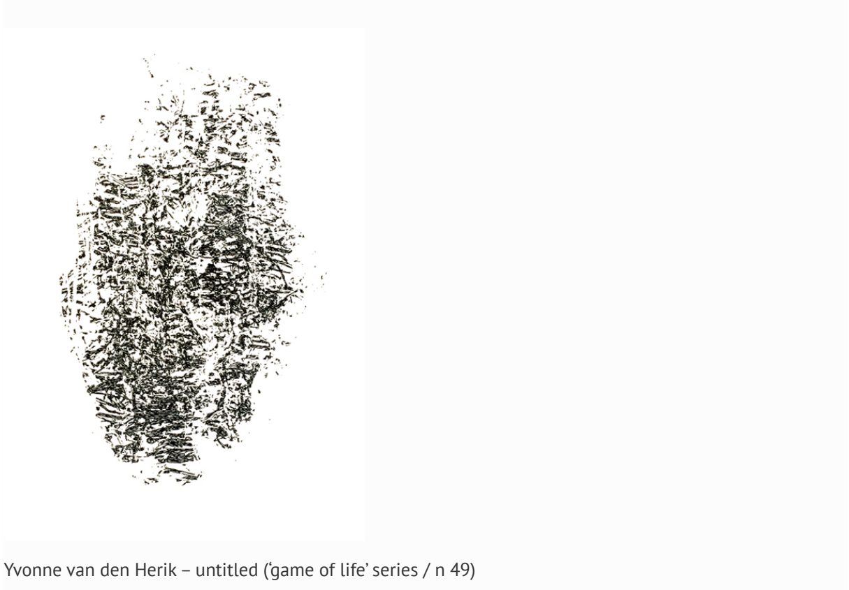
Yvonne van den Herik – untitled ('game of life' series / n 49)